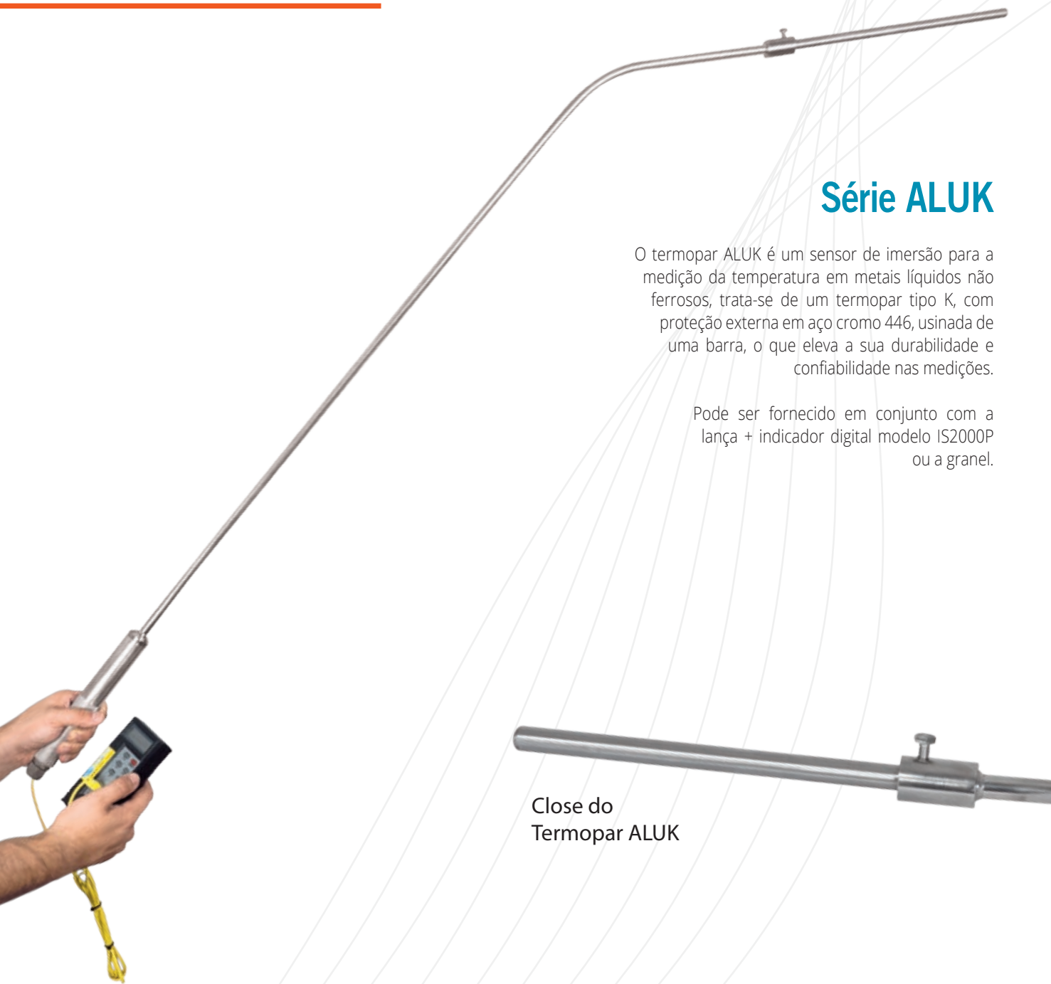
Close do Termopar ALUK

Pode ser fornecido em conjunto com a lança + indicador digital modelo IS2000P ou a granel.