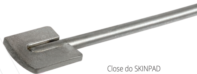
Close do SKINPAD