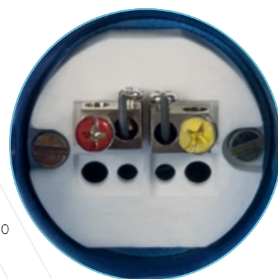
Close do Sensor