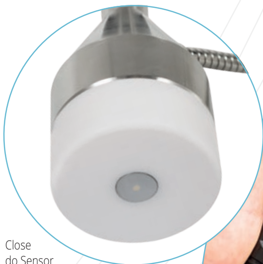
Close do Sensor